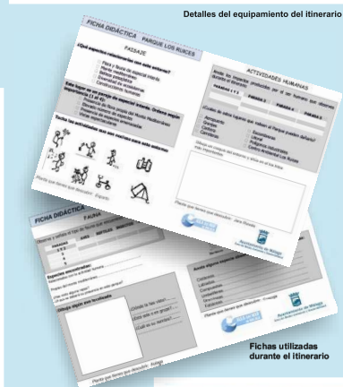
Fichas utilizadas durante el itinerario