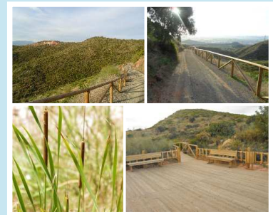
Detalles del equipamiento del itinerario

La página web del Área de Medio Ambiente y Sostenibilidad contiene una guía exhaustiva de los contenidos del itinerario, incluyendo el catálogo de flora realizado al efecto. Por tanto constituye un recurso didáctico para el trabajo en el aula: http://www.lineaverdemalaga.com/medioambiente/doc_itinerarios.asp